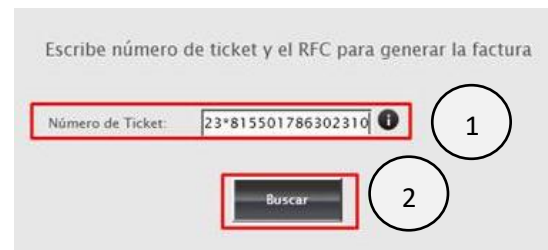
Ingresar folio Fig.3