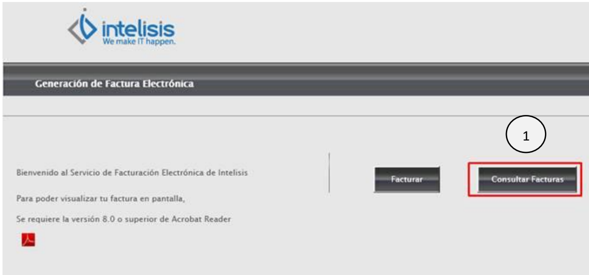
Dar clic en consultar facturas Fig.1